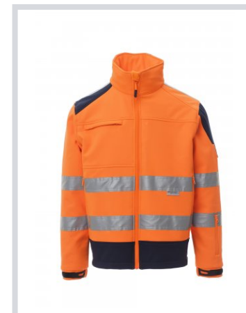
ARANCIONE FLUO/BLU NAVY