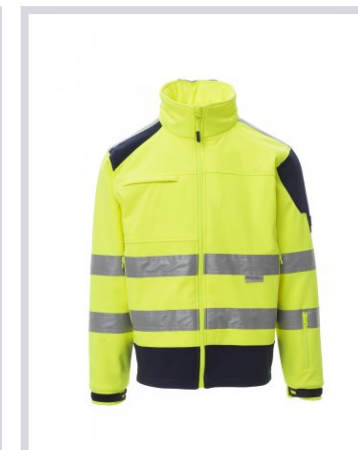
GIALLO FLUO/BLU NAVY